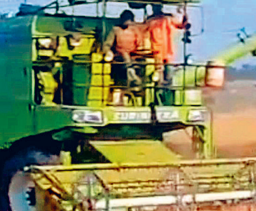
छत्तीसगढ़, मध्यप्रदेश, हरियाणा व दिल्ली से एक साथ प्रकाशित