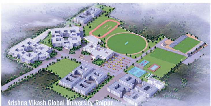
Krishna Vikash Global University, Raipur