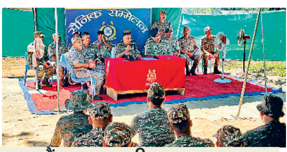
सुरक्षा कैम्प का जायजा लिया

स्थानीय पुलिस एवं सुरक्षा बलों द्वारा संयुक्त रूप से मिलकर किये जा रहे नवीन सुरक्षा कैम्प का जायजा लिया। साथ ही कैम्प स्थापना, सड़क सुरक्षा, निर्माणधीन पुन-पुलियों, सामुदायिक पुलिसिंग, सहित नियतद नेला नार कार्य योजना के तहत किये जा रहे विकास कार्य, क्षेत्र में जनप्रतिनिधियों व नागरिकों को सुरक्षा, वर्तमान परिस्थितियों सहित एवं नक्सल विरोधी अभियान के दौरान विशेष सतर्कता बरतते हुये प्रभावी रूप से कार्य करने के स्थानीय पुलिस, सुरक्षा बलों के अधिकारियों को आवश्यक दिशा-निर्देश दिए गए।