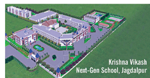
Krishna Vikash Next-Gen School, Jagdalpur

कृष्णा विकाश एजुकेशनल ग्रुप के पास अब जगदलपुर और भिलाई में पूर्ण परिसर हैं।