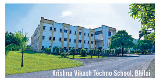
Krishna Vikash Techno School, Bhilai